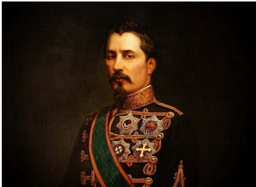
Al.I. Cuza – Domn al Principatelor Unite ale Moldovei și Țării Românești (1859-1866)

„Alegându-te pe tine domn... am voit să arătăm lumii aceea ce toată țara dorește: la legi noi, om nou... Fii dar omul epocii; fă ca legea să înlocuiască arbitrarul! Fă ca legea să fie tare, iar tu, Maria Ta, ca domn, fii bun, fii blând; fii bun mai ales cu aceia pentru care mai toți domnii trecuți au fost nepăsători sau răi!”