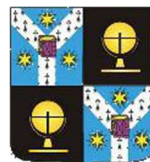
Departamentul de Geografie, Facultatea de Geografie și Geologie, UAIC, Iași