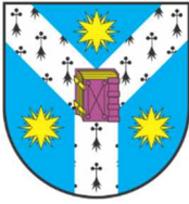
Universitatea "Alexandru Ioan Cuza" din Iași, România