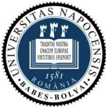
Universitatea "Babeș- Bolyai" din Cluj- Napoca, România