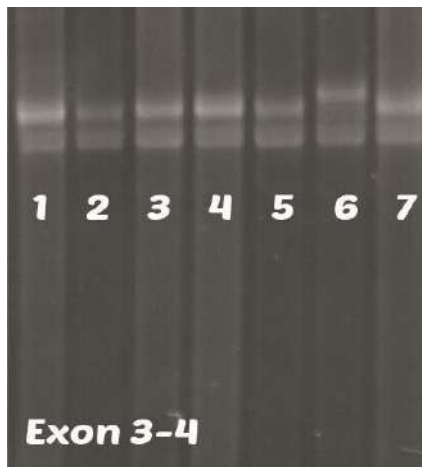
Picture 1. Track number 6 shows abnormal SSCP pattern.

The first step of this protocol is to locate mutations using the SSCP method (pic. 1). This way it is possible to find out which exons contain mutations even before Sanger sequencing. It helps to save time and money performing necessary minimum of sequencing reactions.