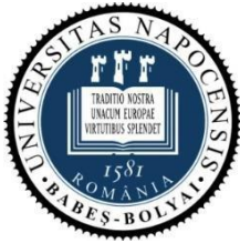
Universitatea "Babeș-Bolyai" din Cluj-Napoca, România