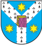
Universitatea "Alexandru Ioan Cuza" din Iași, România