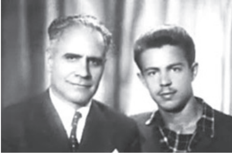
Two Mikhaels